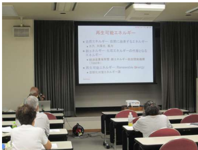
「地質科学講座：国内の地熱資源」→