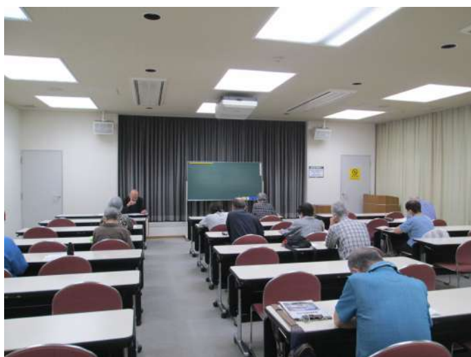
←「歴史文化講座：西浄寺住職 林宝仙について」