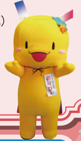
狭山市七夕の妖精 おりひい