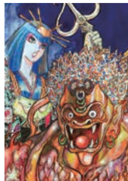
サムライトルーパー