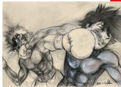
あしたのジョー © 高森朝雄・ちばてつや / 講談社・TMS