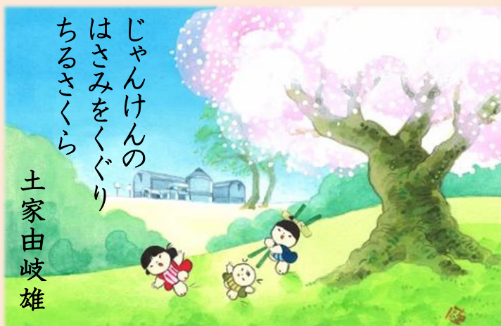
池原昭治『残しておきたい狭山の風景』より「狭山稲荷山公園」