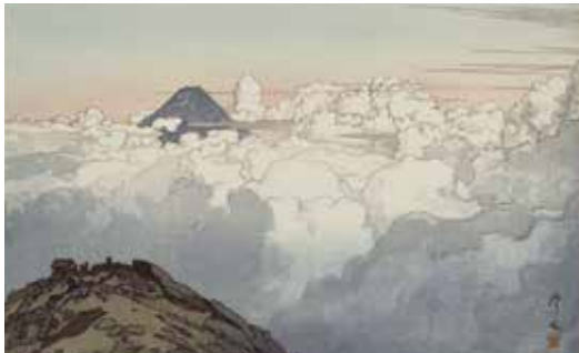
「駒ヶ岳山頂より」1928年 木版、紙