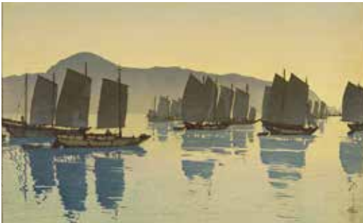
「阿武鬼の朝」1930年 木版、紙